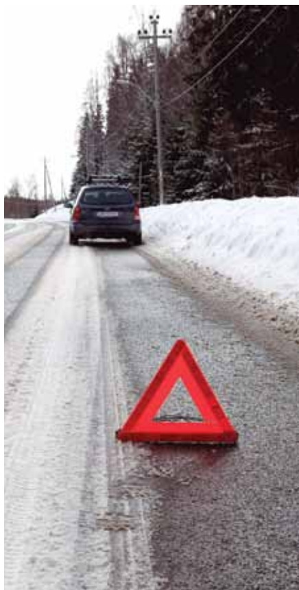
Forsikringen leveres av SpareBank 1.

Låner du bort bilen til personer under 23 år, er det større sjanse for at uhell kan skje. Derfor økes normalt egenandelen ved kaskoskader med kr 6 000,-. Ved å kjøpe ungdomsgaranti for kr 900,- per år, slipper du den økte egenandelen. Dersom du har brukere av bilen under 23 år, vil forsikringen også koste noe mer.